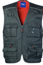
12 - GRIGIO