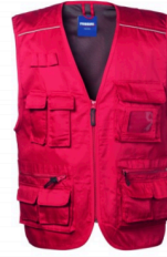
07 - ROSSO