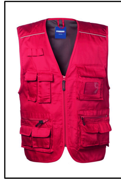
07 - ROSSO