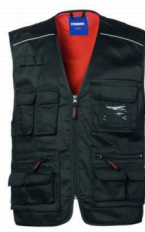
05 - NERO