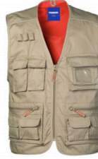
22 - SABBIA