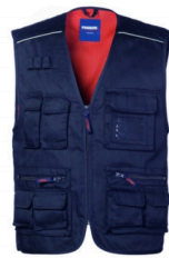
01 - BLU

Due piccoli taschini con soffietto chiusi con aletta e velcro, due tasconi con soffietto chiusi con cerniera.