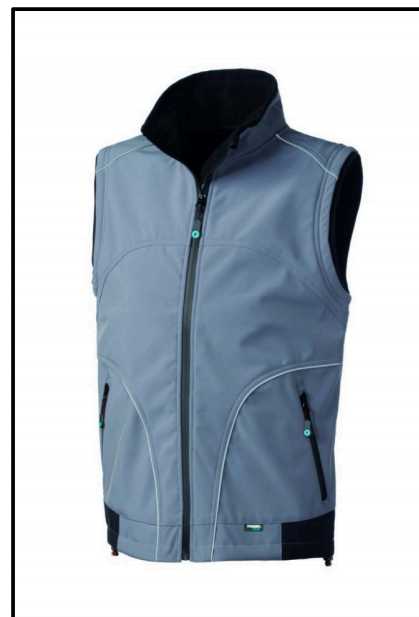
GY – GRIGIO/NERO