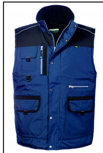
ZX – BLU/NERO