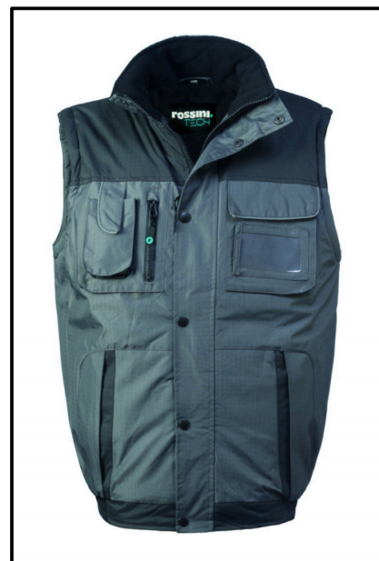
GY – GRIGIO/NERO