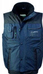
ZX – BLU/NERO