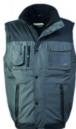
GY – GRIGIO/NERO