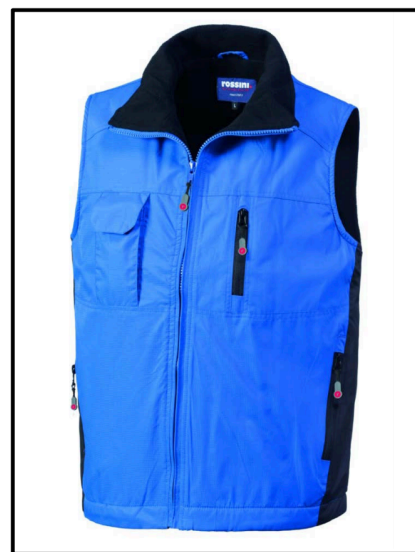
XG - ROYAL/NERO