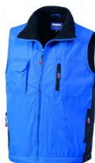
XG - ROYAL/NERO