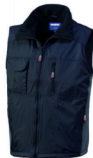
ZY - NERO/GRIGIO