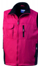
07 - ROSSO/NERO