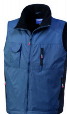
01 - BLU/NERO