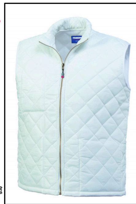
02 – BIANCO

CE rossini. 1° categoria per rischi minimi