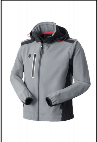
12 – GRIGIO