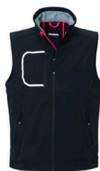
05 – NERO