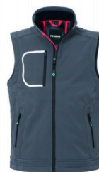
12 – GRIGIO