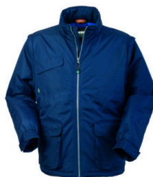
01 - BLU