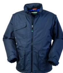
12 - GRIGIO