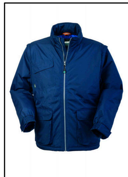
01 - BLU