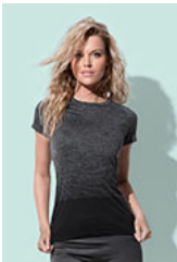
ST8910 Seamless Raglan Flow