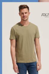
MILO MEN 02076