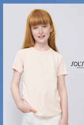
MILO KIDS 02078

Dimensioni della scatola: 52 x 32 x 20 cm weight : 7 kg